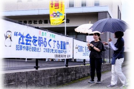
横断幕(始良市始良)