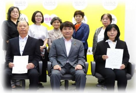
内閣総理大臣メッセージ伝達式(始良市)