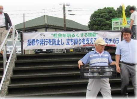
横断幕(霧島市溝辺)