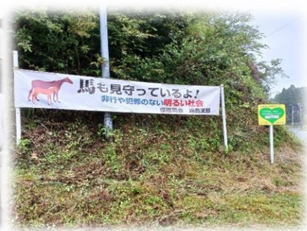
横断幕(霧島市霧島)