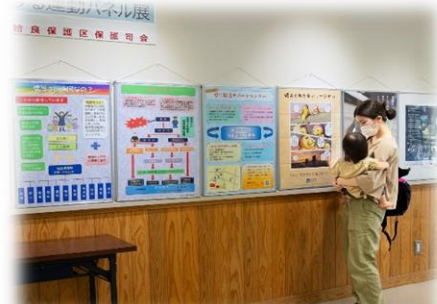
更生保護パネル展示(始良市)