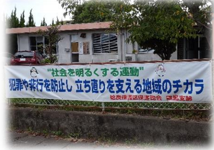
横断幕(サポートセンター前)