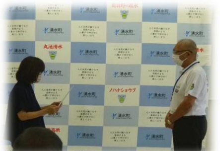
内閣総理大臣メッセージ伝達式(湧水町)