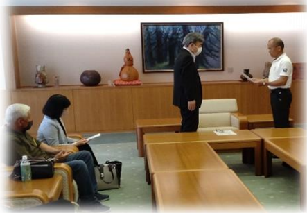
内閣総理大臣メッセージ伝達式(霧島市)