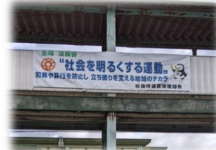
横断幕(始良市加治木)