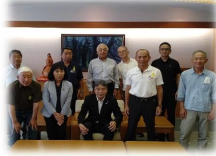
内閣総理大臣メッセージ伝達式(霧島市)