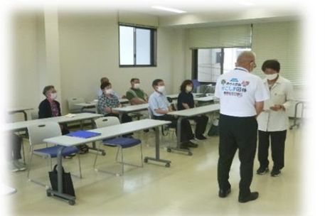
内閣総理大臣メッセージ伝達式(湧水町)